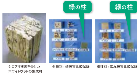
シロアリ被害を受けたホワイトウッドの集成材

一般的に腐れやシロアリに強いとされるヒノキ、ヒバであっても、実際には下の写真のように被害にあいます。住宅用構造材として広く使用されているホワイトウッド（集成材）は一番被害にあっています。優れた耐久性を発揮した「緑の柱」は被害にあっていません。「緑の柱」は「腐れ・シロアリ被害」から家を守り、家を長持ちさせます。