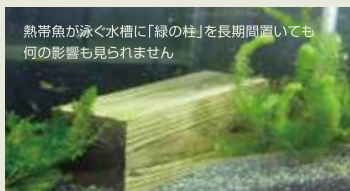
熱帯魚が泳ぐ水槽に「緑の柱」を長期間置いても何の影響も見られません

建ててしまうと隠れてしまう部分も、「緑の柱」ならメンテナンスフリーなので、リフォーム時は、内・外装だけで済みます。